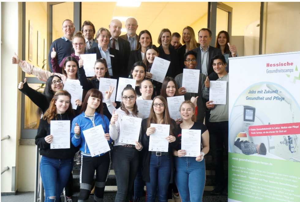
20 Jugendliche aus der Region Frankfurt/Offenbach nutzten die Möglichkeit, sich im Rahmen der Hessischen Gesundheitscamps über Gesundheitsberufe zu informieren. © 2019 Provalids Partner für Bildung und Beratung GmbH

© 2019 Provalids Partner für Bildung und Beratung GmbH